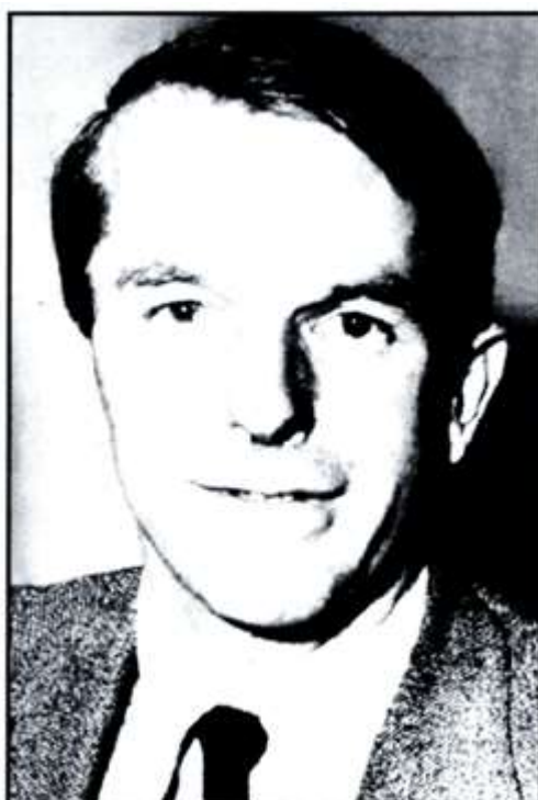
Figura 4: Federico Sanger, publicó la fórmula estructural de la insulina bovina