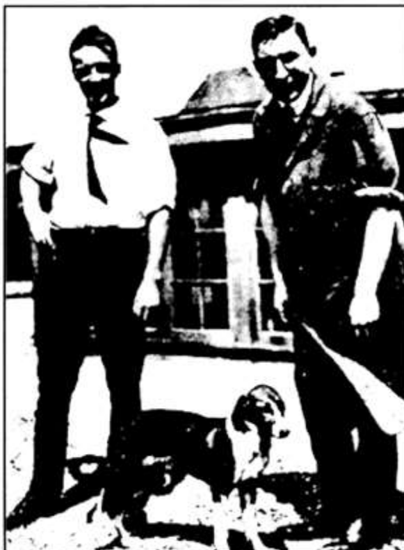
Figura 3: Bating y Best con Marjorie, perra pancreatectomizada y mantenida viva con insulina