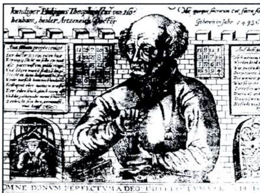
Fig. 1: Teofrasto Bombaste de Hoeim (Paracelso).