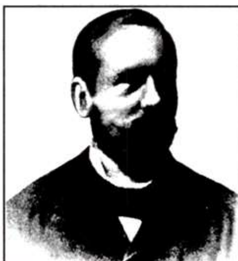
Figura 2: Pablo Langerhans (1847-1888)